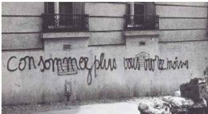
Figura 9: Escrito nos muros de Paris, 1968. “Consuma mais você viverá menos”.

Era sabido que tais intervenções eram realizadas de maneira ilegal, mas Grootveld não se preocupava em se esconder ou permanecer anônimo; neste caso, o oposto também não se aplicava. Não havia assinatura no que era realizado, e a intenção primordial nestas intervenções não era autopromoção, mesmo que Grootveld nunca tenha se oposto a esse tipo de exposição de sua imagem ou encontrado dificuldade em fazê-la. As ações ocorriam de maneira aleatória e a única conexão entre elas, além do alvo, era a menção ao câncer. Como consequência de optar conscientemente pela falta de precaução ao realizar uma ação contra a lei, e subverter a imagem das propagandas de grandes fábricas, Grootveld deixou empresários furiosos e, após denúncias, foi detido em flagrante.