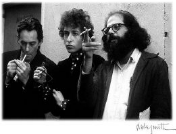
Figura 3: Michael McClure, Bob Dylan e Allen Ginsberg. São Francisco, 1965.

que a partir de suas letras afiadas em paralelo à não agressividade do folk , criou uma espécie de vínculo instantâneo com a juventude inconformada com a guerra do Vietnã, com seus horrores televisio- nados e escancarados nas salas de jantar estadunidenses. Dylan se tor- nou um fenômeno que arrastou multidões em suas turnês, afirmando que nada havia sido feito a não ser “construir para destruir” 4 , Versos de Dylan poderiam, e de fato cabiam, nas estrofes literárias dos Beats.