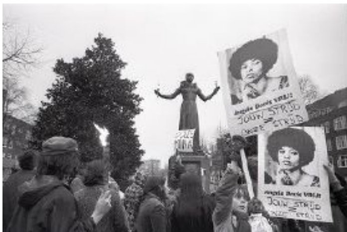
Figura 44: Protesto pela liberdade de Angela Davis “Angela Davis Livre, Sua Luta é Nossa Luta” sob a estátua de Whilhemina, símbolo do grupo.

acesso feminino à educação, ao aborto, e à educação infantil obtiveram grande avanço no país. 150 Mas outras, como a igualdade salarial 151 , continuam sendo tema de grupos feministas atuais.