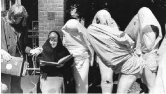
Figura 43: Protesto contra decisão da Igreja Católica a respeito do uso de contraceptivos. Foto de Berf Verhoeff, 1974. Arquivo Nacional.

Outros slogans foram disseminados, como “chefe da própria barriga”, em oposição à ausência do controle de natalidade, e “mesmo uma gaiola dourada continua uma gaiola”, cunhado após a intervenção e instalação de uma gaiola dourada em uma feira de artigos domésticos dedicados à mulher.