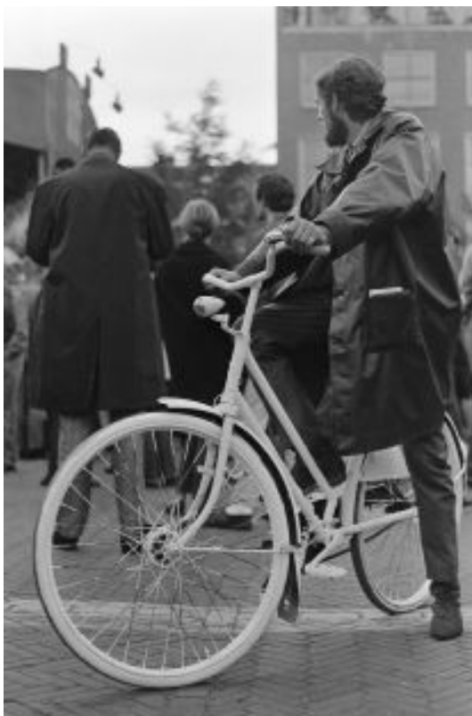
Figura 36: Jovem com a bicicleta branca. Foto de Kuppen, 1966. Arquivo Nacional.