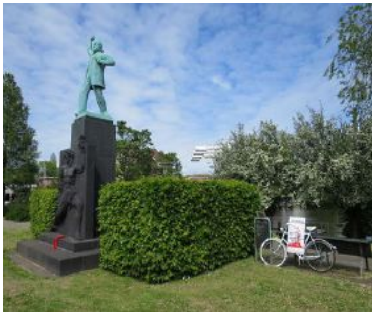
Figura 10: Estátua de Domela Nieuwenhuis e, ao lado, bicicleta branca do Provos.

Enquanto trabalhava na fachada de seu templo, Grootveld pode ser visto no vídeo de Lecq, trajando uma roupa estereotipada de artista, boina e cachecol, um figurino atribuído à própria ideia de artista, jogando baldes de tinta na porta de seu templo, como alusão ao expressionismo abstrato e à action painting . Quase sempre exagerado, Grootveld utilizava o figurino como recurso para acentuar suas críticas e zombarias, assim como havia feito anos atrás com o personagem folclórico holandês. 39 Simon Vinkenoog foi um dos primeiros a