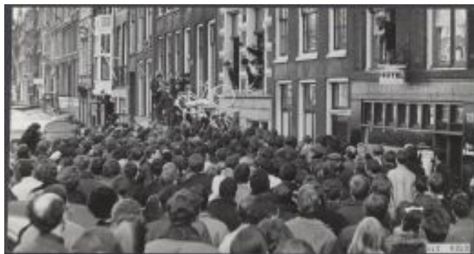
Figura 35: Plano das bicicletas brancas. Foto de Joost Evers, 1966. Arquivo Nacional

No dia 28 de julho, enquanto Grootveld estava estendido no asfalto, em protesto pelas prisões ocasionadas pela distribuição do Provokatie #5, simultaneamente integrantes do Provos pintavam bicicletas de branco. A polícia avisou que, caso não obstruíssem o trânsito, ninguém seria detido. Após alguns se recusarem, mais policiais apareceram em seus carros, recebidos ao som de mugidos, após o Provos denominar os automóveis “ Holy Cows ” 124 (KEMPTON 2007, p.49).