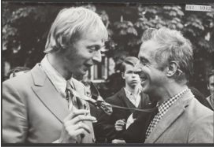
Figura 32: Simon Vinkenoog (esquerda) e Aldo van Eyck (direita) no Vondelpark durante o comitê de liquidação. Foto de Bem Merk, 1967. Arquivo Nacional.

De acordo com Kempton (2007, p.108) o Provos não estava lutando contra um “homem do mal”, e sim contra uma visão autoritária antiquada, que era mantida por uma geração diferente de “pessoas boas”. Essa luta contra a mentalidade autoritária banuiu os outros partidos holandeses de sérias considerações dentro de seu próprio espectro político. Schoenberger (2017, p.200) afirma que a arte aparentemente sem propósito, clara referência ao trabalho de Grootveld, pode ser instrumento de mudança social. A estratégia lúdica pode ser direcionada a uma transformação demonstrável ou, pelo menos, em direção a uma mudança de consciência.