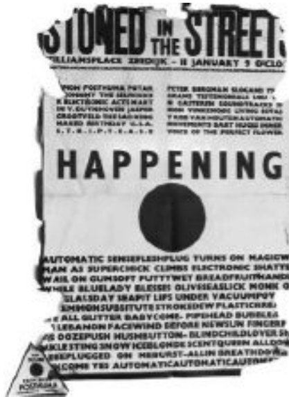
Figura 7: Pôster do happening Stoned in The Streets , Janeiro de 1965.

Robert Jasper Grootveld foi o grande nome da vertente artística do Provos. Seu envolvimento com a arte começou muitos anos antes do Provos e perdurou por toda vida. Sua produção artística e biografia se misturam de tal maneira que impossibilitam a compreensão de um aspecto isolado do outro.