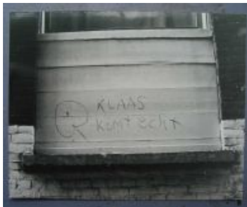
Figura 14: “Klaas realmente está vindo”.

No dia 28 de junho de 1965, Klaas realmente chegou, mas com a grafia alemã, ou seja, Klaus. Klaus von Amsberg 57 (1926-2002) chegou a Amsterdam, diplomata alemão, que havia servido ao exército nazista, oficializou o noivado com a herdeira do trono de Orange, a princesa Beatriz (1938-). Este acontecimento é mencionado em todas as obras referentes ao Provos e seus integrantes como o grande ponto de virada, ou de partida, para o nascimento e perpetuação do Provos, concretizando a profecia de Grootveld.