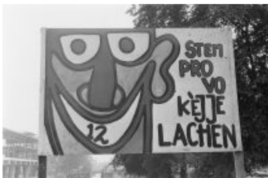
Figura 26: “Vote Provos e dê gargalhadas”. Foto de Joost Evers, 1965.

Em 30 de abril, na tradicional festa Koningsdag 94 , o Provos optou por celebrar provoritariamente. 95 Iniciaram as festividades com uma gravação chamada “performance Provonadu Orquestra”, jogaram pó de suco de limão na fonte do Leidsplein e realizaram um concurso de miss Provo, no qual foi coroada uma garotinha de dois anos. 96 A celebração foi encerrada, novamente, com prisões.