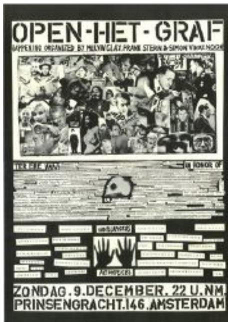
Figura 4: Pôster do Open het Graf. Fotolitogravura, 57,5 x 40,5 cm, 1962.

Vinkenoog, depois desses eventos, viria a ser considerado um dos mais importantes nomes da literatura holandesa, mesmo que não acreditasse na divisão das artes em categorias como teatro, música, literatura e artes plásticas. Dessa maneira, encontrou no happening uma ótima solução para a reunião das especificidades e dissolução de papéis específicos, como o dos atores, músicos, poetas e artistas. Fundador de algumas revistas literárias, dentre elas a Blurb 21 , Vinkenoog acreditava que o título traduziria a incredulidade no ato de encontrar palavras escabrosas em dicionários inexistentes, escolhendo o balbucio como uma sinopse e, desta forma, as possibilidades se tornariam ilimitadas. Seu nome se tornou o de maior destaque dentre os Vrijers