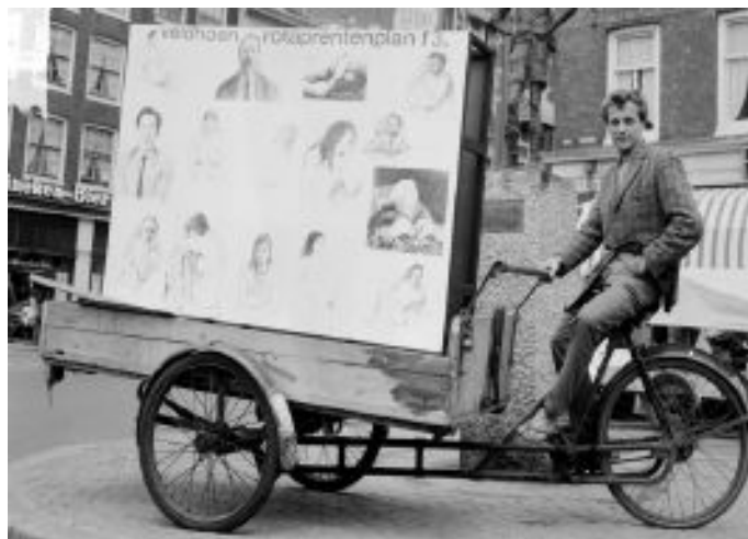
Figura 12: Robert Jasper Grootveld a bicicleta cargo e a rotaprentenplan , Spui, julho 1964.

como relações sociais. As gravuras ficavam expostas na bicicleta cargo de Grootveld, cuja proposta original era a distribuição gratuita mas, por fim, foram vendidas por 3 guilders durante os happenings (SCHOENBERGER, 2020 p.83).