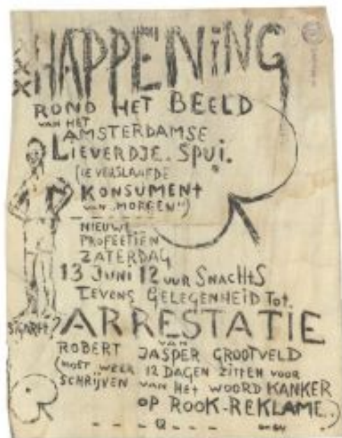
Figura 13: HAPPENING : em torno da escultura Lieverdje. Spui . (Consumidores viciados do “amanhã”) – Novas profecias – sábado 13 de junho 12 horas noite. Também uma ótima oportunidade de prender Robert Jasper Grootveld (que precisa de passar mais 12 dias sentado por escrever a palavra câncer em propagandas de cigarro).

A somatória das críticas de Grootveld resultava em predições consideradas por Kempton (2007, p.19) como proféticas durante os happenings . Em um deles, afirmou que Amsterdam era o “centro mágico da selva de asfalto” e atrairia massiva quantidade de jovens de diversas partes do mundo no futuro. A partir da publicidade, a cidade se tornaria um ímã, que atrairia jovens com seu magnetismo. Em outro happening , previu que a imprensa se tornaria tão corrupta que, no futuro, os jornais ilegais iriam se espalhar de tal forma que cada um teria sua espécie de imprensa própria, um jornal pessoal, de experiências humanas com comunicação.