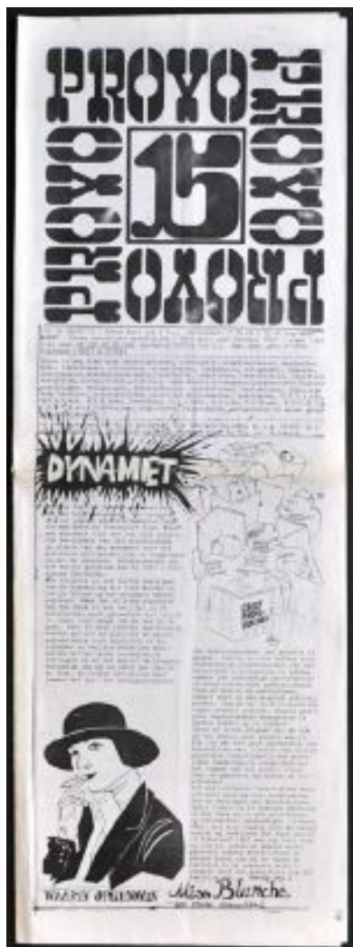
Figura 31: Capa da edição de número 15, última publicação oficial Provos, Datada em 17 de março de 1967. Design de Swip Stolk.