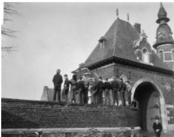
Figura 30: Integrantes do Provos no castelo Borgharen, em Maastricht. Foto de Joop Bilsen, 1966. Arquivo Nacional.

Stolk, que não se pronunciava tão constantemente como Van Duijn e Grootveld, também frisou nesta entrevista que o Provos não tinha relação alguma com os ocorridos do dia 14, mas mesmo sem acreditar na violência pessoalmente, compreendia a motivação das pessoas. Foi dito também que o apelo inicial do Provos havia passado, à medida que também perdeu influência com o provotariado. As mutações do Provos levavam diferentes grupos a seguir diferentes versões do Provos, mas a resistência permaneceria. Além disso, muitas pessoas que se envolveram com o Provos aprenderam sobre impressões, tipografia, fotografia. De fato, isso seria imutável, por mais que a produção de alguns se encerrasse junto com o Provos.