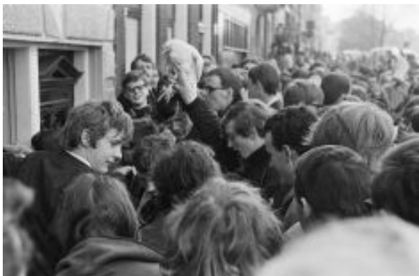
Figura 23: Happening da galinha. Foto de Joost Evers, 1966. Arquivo Nacional

De acordo com a narrativa de Kempton (2007, p.72), em consequência da dimensão da importância da procissão, a polícia, por ordem de Van Hall, ficou restrita a intervir apenas em atos considerados criminosos, para que não houvesse pânico ou tumulto durante a procissão, visto que metade de seu eleitorado era composto por católicos. Nessa mesma noite, os jovens se dividiram, alguns acenderam fogueiras nos portões do palácio real e outros passaram a noite uivando na janela da residência do prefeito.