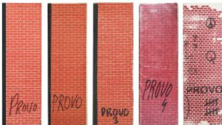
Figura 18: Capa das edições 1,2,3,4 e 10.

(REBELSE STAD, 2015), era apenas ensinar uma lição e todas as receitas eram de fato piadas. Principalmente uma pequena parte do papel que continha um local delimitado, onde leitor deveria martelar, para que ocorresse uma explosão. Esta explosão demarcaria o início da revolução em sua própria vida. Toda atenção a este conteúdo resultou em um grande aumento do número de membros, simpatizantes, e apoiadores, que subiu, de 50 para 5 mil nos meses subsequentes, ainda que o Provos não tivesse um registro oficial de participantes. De acordo com Stolk, “nós não os registramos, a polícia é quem faz isso” (REBELSE STAD, 2015).