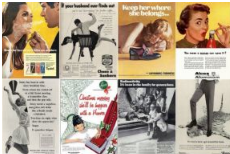
Figura 1: Propagandas diversas publicadas em revistas estadunidenses durante as décadas de 60 e 70.

Essas narrativas criadas pela propaganda da época foram demonstradas na atual indústria do entretenimento midiático em séries televisivas como Mad Men (2007-2015), cuja trama acompanha essa transição mundial a partir do ponto de vista de um publicitário bem-sucedido vivendo esse sonho americano e, também, pela construção de personagens femininas, como sua esposa, dona de casa e mãe infeliz à beira de um colapso nervoso, e as funcionárias do escritório durante a segunda onda feminista, que será tratada futuramente nesta pesquisa.