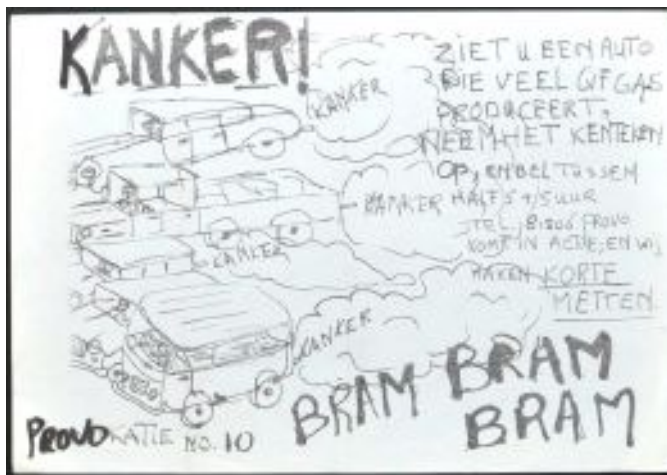
Figura 37: Provokatie #10. 20 de janeiro de 1966.