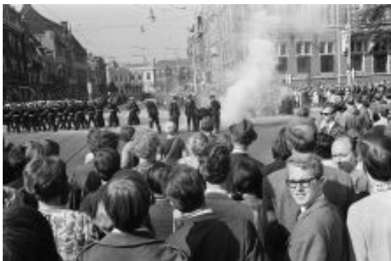
Figura 22: Protestos durante o casamento da princesa Beatrix. Arquivo Nacional, 1966.

“ Multi-headed monster without a leader ”, foi uma frase usada para descrever o Provos por seus próprios integrantes. 82 E foi dessa maneira que o Provos prosseguiu. Após o dia 10 de março, estudantes decidiram organizar uma exposição fotográfica denominada 10-3-66 e realizada na galeria Polak & Van Gengracht, cuja temática foi a brutalidade policial, no dia 19 de março, um sábado. A abertura ficou por conta do escritor, pintor e escultor Jan Wolkers 83 . Wolkers pretendia abrir a exposição com um happening , no qual penduraria uma nota ao povo vietnamita em uma galinha branca e, quando esta chegasse ao Vietnã, todos teriam paz (KEMPTON, 2007, p.69). As coisas não correram tão bem e a galinha 84 acabou sendo arremessada sobre o público que aguardava na fila (GUARNACCIA, 2010, p.117). Após Wolkers recuperar sua galinha e realizar um discurso,