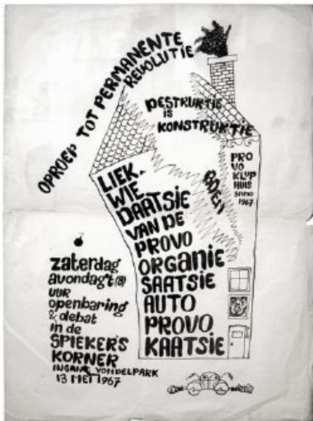
Figura 33: Pôster que anuncia a liquidação do Provos, 13 de maio de 1967. Design de Rob Stolk.