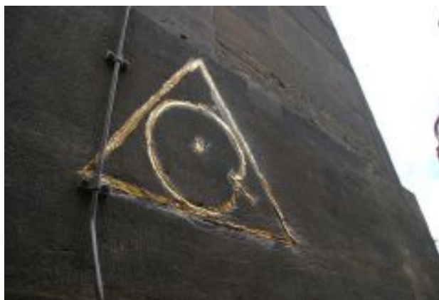
Figura 17: Monumento temporário do Gnot , Amsterdam, julho 2012.

Ainda de acordo com Schoenberger (2017, p.182), Van Duijn afirmou recordar que Grootveld disse que seu pai era anarquista, e que deveriam trabalhar juntos. Outro ponto importante destacado pela autora foi o Gnot , o desenho simbolístico de Grootveld datado em 1962 (2009, p. 221), adotado pelo Provos como seu símbolo. Para Grootveld, o desenho não pertencia a ninguém e poderia ser usado por qualquer um, pois se tratava de uma representação gráfica do “centro mágico”, cuja linha representava a intersecção do rio Amstel. A autora apresenta também diversas outras interpretações dadas ao Gnot , como a do historiador Richter Roegholt, que sugeriu um embrião com o cordão umbilical, uma caricatura do consumidor com um cigarro em sua boca, uma nuvem cogumelo formada por uma bomba atômica 64 , dentre outros.