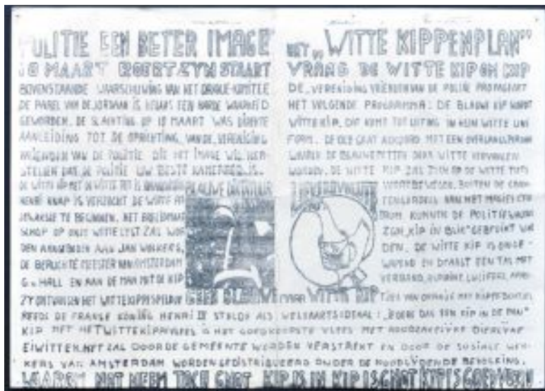
Figura 38: Plano da Galinha Branca. Assinado por: Auke Boersma, Peter Bronkhorst, Roel Van Duijn e Hans Tuijnman. 19 de março de 1966.

quilômetros do ponto de emissão. Os impostos seriam divididos uniformemente aos produtores e indústrias, calculados de acordo com o volume de gases poluentes emitidos (GUARNACCIA, 2010 p.124). 130