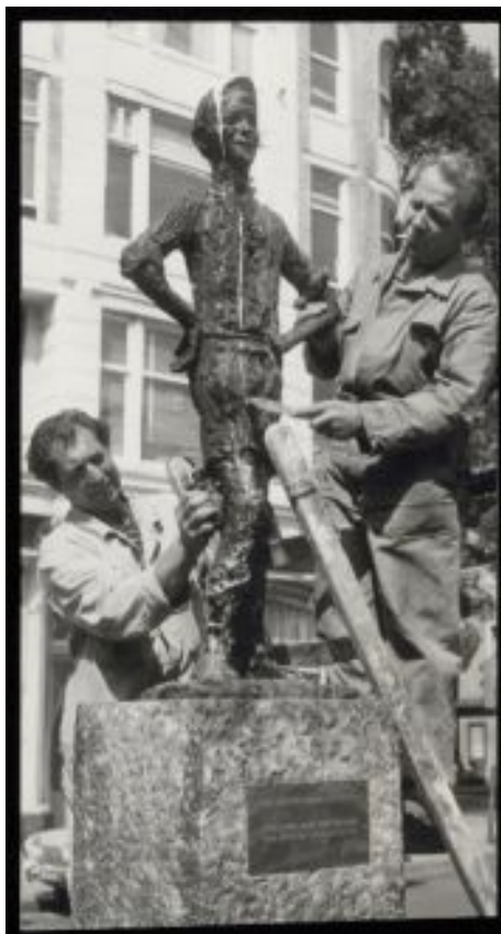
Figura 11: Estátua Lieverdje . 1965.

forma, o conceitualismo lúdico usa a linguagem como ferramenta de paródia à cultura dominante. Acima de tudo, distinguida por uma oblíqua crítica da cultura dominante, a partir de uma posição marginal. (SCHOENBERGER, 2017, p. 250, em livre tradução)