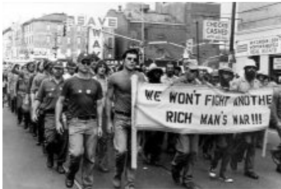
Figura 2: Manifestações nas ruas dos Estados Unidos: "Nós não lutaremos outra guerra de homens ricos".

A Guerra dos Estados Unidos contra o Vietnã serviu como um grande estopim para os jovens que estavam, em sua grande maioria, completamente desinteressados da obrigatoriedade de participação em um conflito armado de grandes proporções. A Guerra do Vietnã durou vinte anos, entre 1955 e 1975, parte de um conflito maior denominado Guerra Fria. Caracterizou-se como um conflito em que dois governos lutavam pela consolidação de seu domínio em um país unificado. Os Estados Unidos, principalmente após a China se tornar um país comunista e da derrocada francesa nos conflitos da Indochina, apoiavam o governo ditatorial sul-vietnamita. O país temia a ameaça comunista vietcongue e mais de dois milhões de jovens norte-americanos foram enviados ao campo de batalha, causando a morte de mais de um milhão de vietnamitas. Informações posteriores revelaram que não havia esperança de vitória estadunidense em tal conflito.