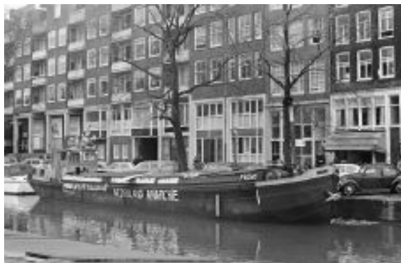
Figura 29: Barco Provos. Foto de Ron Kroon, 1967. Coleção Arquivo Nacional.

subvencionados pelas municipalidades, denominados Provadya. Os mais famosos de Amsterdam foram o Fantasio e o Paradiso , espaços culturais dedicados a shows, debates, venda de livros, discos e produções autorais. Grootveld não era adepto da ideia de frequentar tais ambientes por considerar perigoso aceitar presentes do poder. O Provos foi fiel a suas convicções e cedeu pacificamente aos nozem um de seus espaços na cidade.