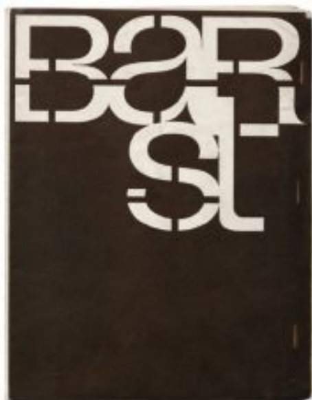
Figura 15: Revista Barst (16 páginas), 21,8 x 17,2 cm. Capa impressa em offset, interior mimeografado. Abril, 1965.