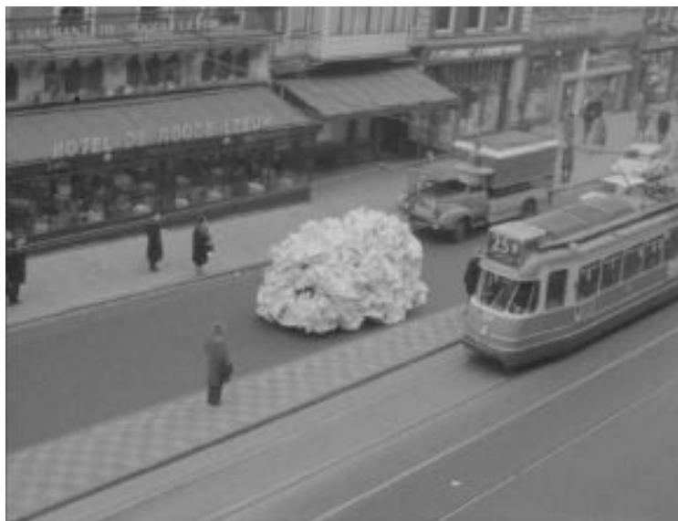
Figura 6: Constelação de papel, Willen de Ridder 1963. Frame.

vez de ser convidado a integrar formalmente o Fluxus se devia ao fato de Maciunas considerar Fluxus um modo de vida (e morte) e não um momento histórico ou movimento artístico.