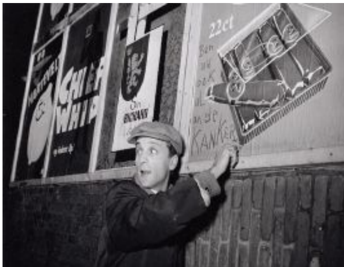
Figura 8: Robert Jasper Grootveld realiza intervenção em propaganda de cigarro, 1961.

As intervenções adquiriram diversas conotações na arte contemporânea, mas não eram amplamente realizadas e categorizadas nos anos de 1961-62. As ações de Grootveld eram realizadas em campanhas tabagistas e automobilísticas, reafirmando seus malefícios ocultos sob inserção dessa “obrigatoriedade” social. Grootveld não se propôs a realizar um trabalho vinculado a qualquer tipo de instituição ou grupo de artistas. Apesar disso, uma comparação com a décollage realizada na mesma época por artistas franceses como Jacques de la Villeglé e Raymond Hains, é quase inevitável para autores como Schoenberger (2017, p.161). Ambos ligados ao Nouveau Réalisme , que questionava os valores sociais do pós-guerra e propunha ressignificações da realidade, através da utilização de materiais cotidianos na produção artística.