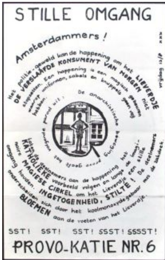
Figura 24: Procissão Silenciosa. Provokatie #6 13 de agosto de 1965.

de telejornais. Com a justificativa de que os congelamentos de tela distorciam a noção da realidade dos fatos ocorridos, o filme foi censurado. O nome vem da justificativa de um jovem estudante de psicologia atingido por cassetetes e chutes por quatro policiais, enquanto justificava que estava no local apenas “porque sua bicicleta estava lá”.